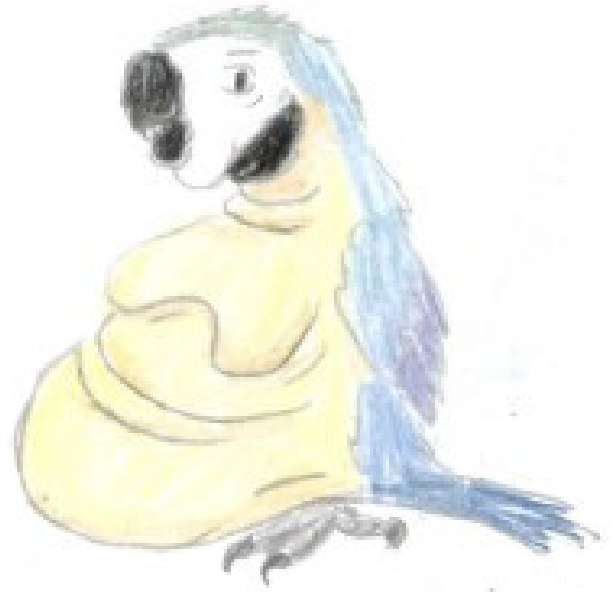
glace au perroquet